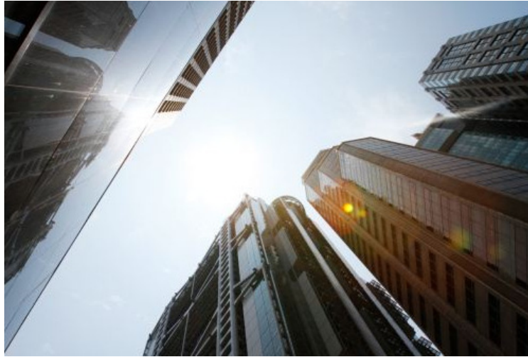
特約資訊 - 中會聯：抗議財庫局及會計師公會打壓中小企 或發起靜坐抗議

<匯港通訊> 中小型會計師行大聯盟(中會聯)召集人鄭中正表示，財經事務及庫務局(財庫局)早前就《優化上市實體核數師監管制度》完成公眾諮詢，但該局將收到的 703 份意見書中，661 份分屬 6 款一式多份的陳述書，歸類為 6 份意見，變成共收到 48 份意見書，最終當局以 42 比 6，認為絕大部分回應都支持改革目的及方向。另外，早前會計師公會曾在報章上表示，計畫修改《專業會計師條例》，用以加快紀律處分程序，並刪減紀律聆訊，而此建議正是該會對財庫局及財務匯報局所反對的提議。